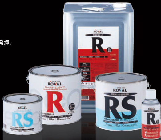
◎上記の各製品には、一斗缶、はけ缶、エアゾールのラインナップがあります。

※3種規制とは「有機溶剤中毒予防規則」、「特定化学物質障害予防規則」、「PRTR法」。